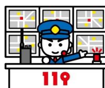
たかさき消防共同指令センター